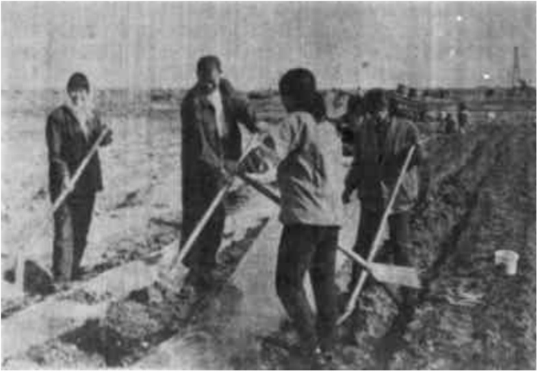
利津县明集乡广泛发动群众，想方设法种足种好棉花。日前，全乡的17000亩棉花种植任务即将完成。

发如何识别假劣农资方面的宣传材料等方式，有力地打击了制售假劣农资的违法行为，提高了农民的自我保护意识，有效地保护了广大农民的合法权益。 在这次为期两个多月的检查活动中，全市共抽调工商人员980人次，出动机动车辆180部，共检查农资经营点320家，变更、注销非法经营点35家，取缔个人经营户30户，关闭农资黑市7处，设立举报电话23部，散发宣传材料5万余份，举办假劣农资展览8次，查获非法经营化肥9.5吨、农药5吨、农用薄膜5.5吨，保证了我市今年的农业生产顺利进行。(李宝亮 段惠莲)